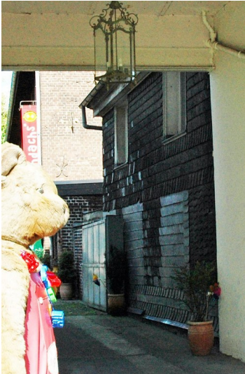
Fachwerkhaus Hauptstraße 86 (Stadt Essen, Baudenkmal Nummer 263) in Essen Kettwig