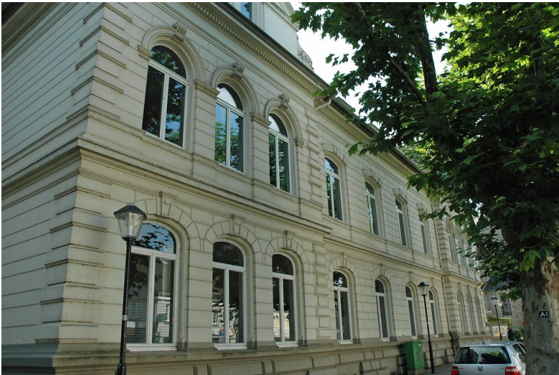
Wohnhaus aus dem 19. Jahrhundert (Stadt Essen Baudenkmal Nummer 262): Hauptstraße 81-83, Essen Kettwig