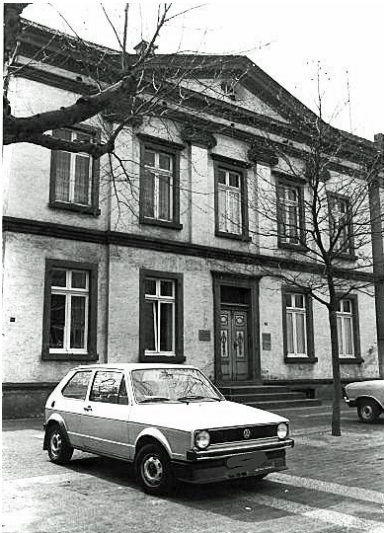
Wohnhaus aus dem 19. Jahrhundert (Stadt Essen Baudenkmal Nummer 210): Hauptstraße 73, Essen Kettwig