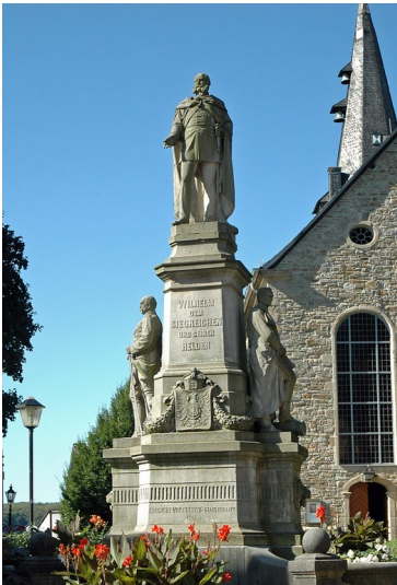
Denkmal für Kaiser Wilhelm I. (Baudenkmal Nummer 798) an der Hauptstraße in Essen Kettwig