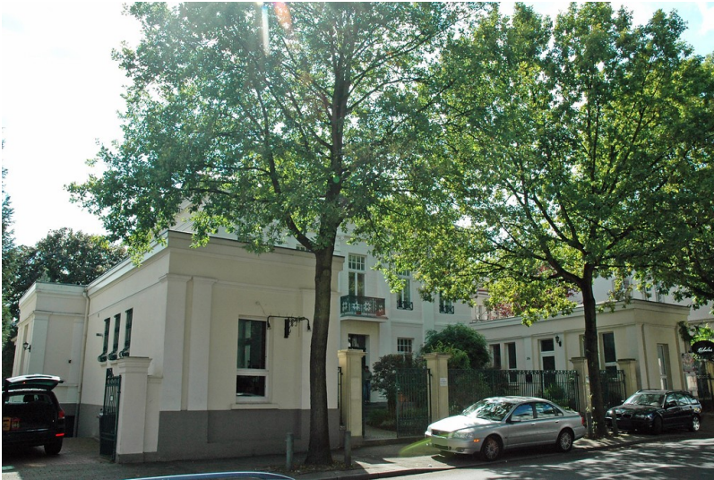
Fabrikantenvilla in der Hauptstraße 29 in Essen Kettwig