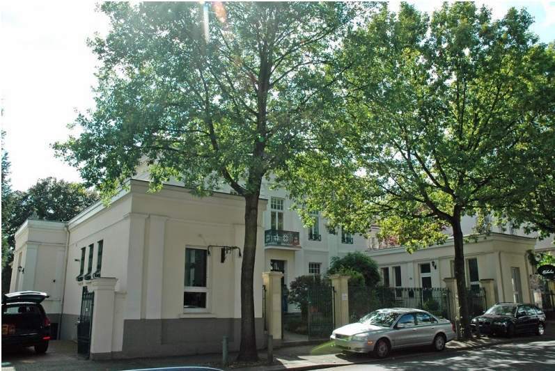
Fabrikantenvilla in der Hauptstraße 29 in Essen Kettwig