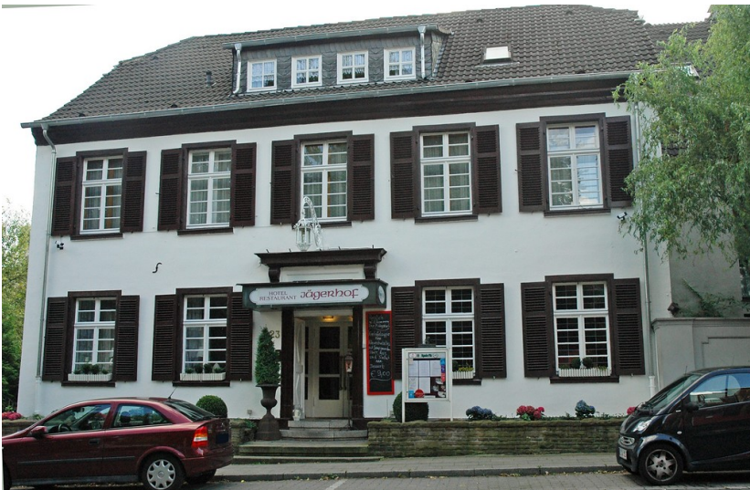
Hotel Jägerhof, Wohnhaus (Stadt Essen Baudenkmal Nummer 258): Hauptstraße 23, Essen Kettwig