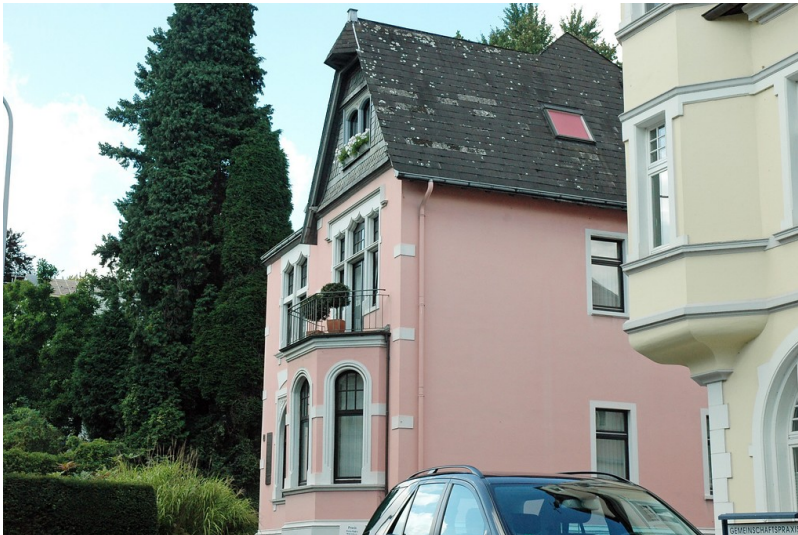
Villa Kantelberg, Wohnhaus (Stadt Essen Baudenkmal Nummer 351): Hauptstraße 12, Essen Kettwig Fotograf/Urheber: Karl-Heinz Buchholz