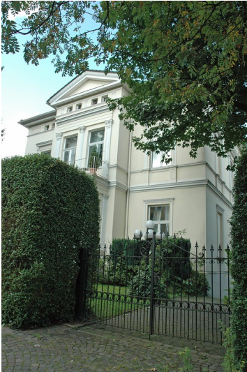
Wohnhaus aus dem 19. Jahrhundert (Stadt Essen Baudenkmal Nummer 257): Hauptstraße 8, Essen Kettwig