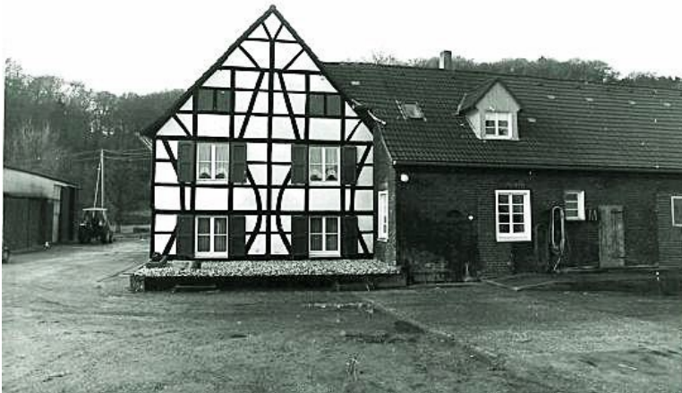
Historisches Foto des Altenbruchshof in Essen