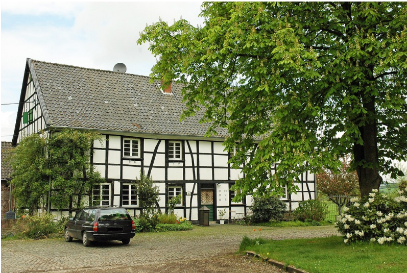
Hof Kowarz (Baudenkmal Nummer 252 der Stadt Essen) in Essen Kettwig