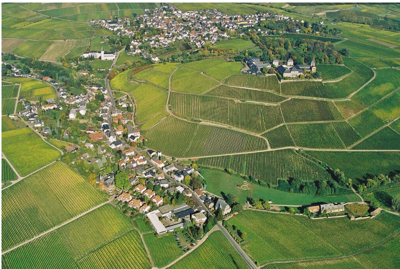
Luftaufnahme der Ortschaft Johannisberg im Rheingau (2006)