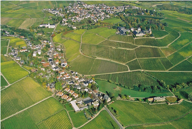
Luftaufnahme der Ortschaft Johannisberg im Rheingau (2006)