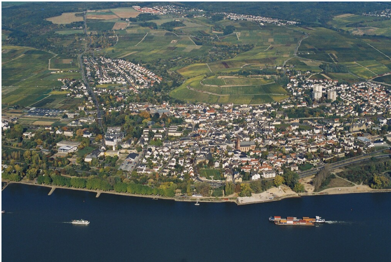
Luftaufnahme von Geisenheim (2006)