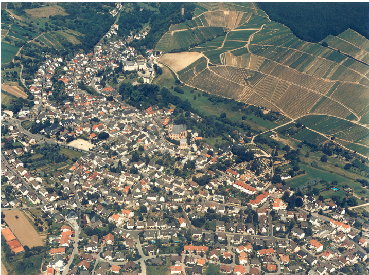
Luftaufnahme der Ortslage von Kiedrich (2011)