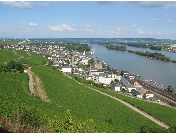
Rüdesheim von Westen aus gesehen (2005)