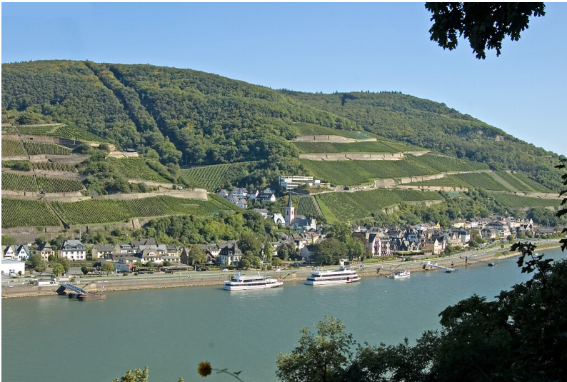
Assmannshausen von Burg Rheinstein aus gesehen (2007)