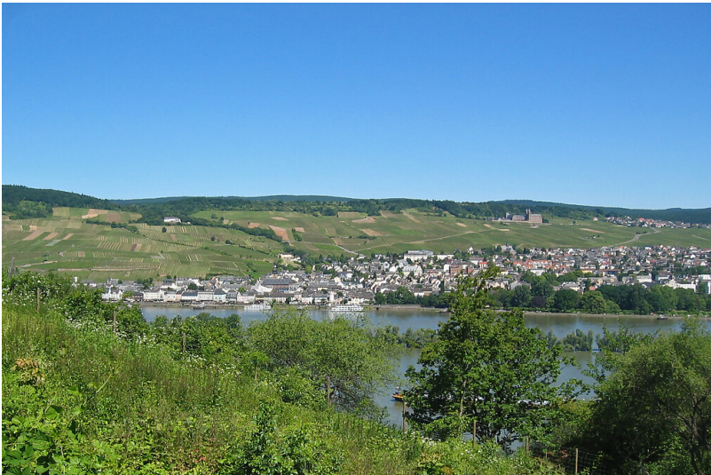
Rüdesheim von Süden aus gesehen (2009)