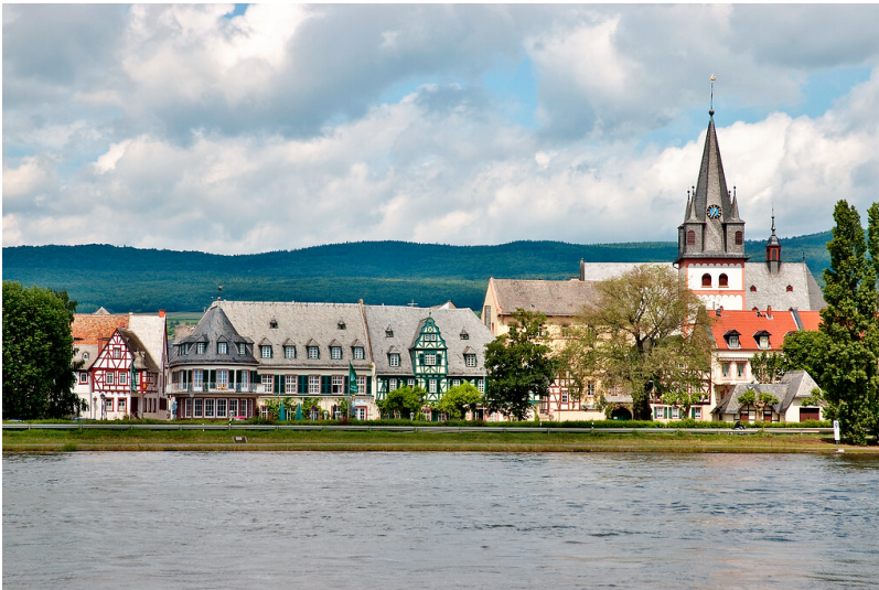
Blick auf die Altstadt von Oestrich (2012)