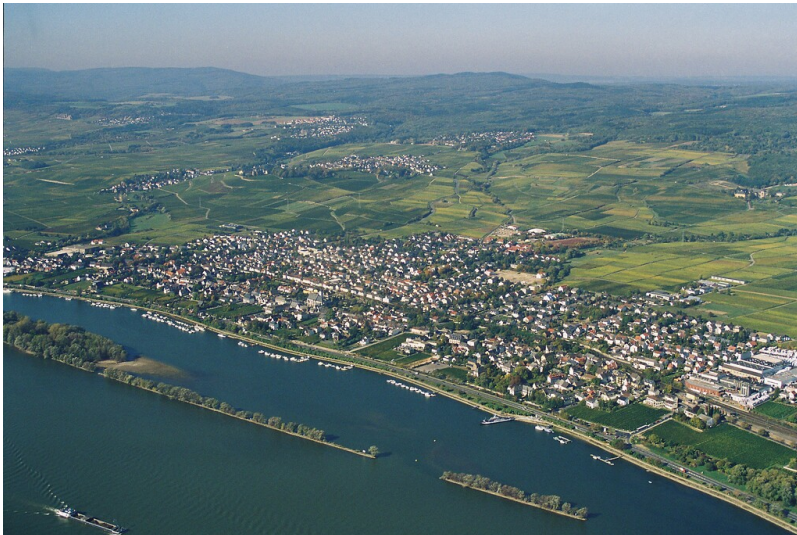
Luftaufnahme von Oestrich-Winkel - Mittelheim (2006)