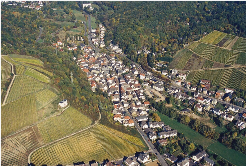
Luftaufnahme von Eltville-Martinsthal (2006)