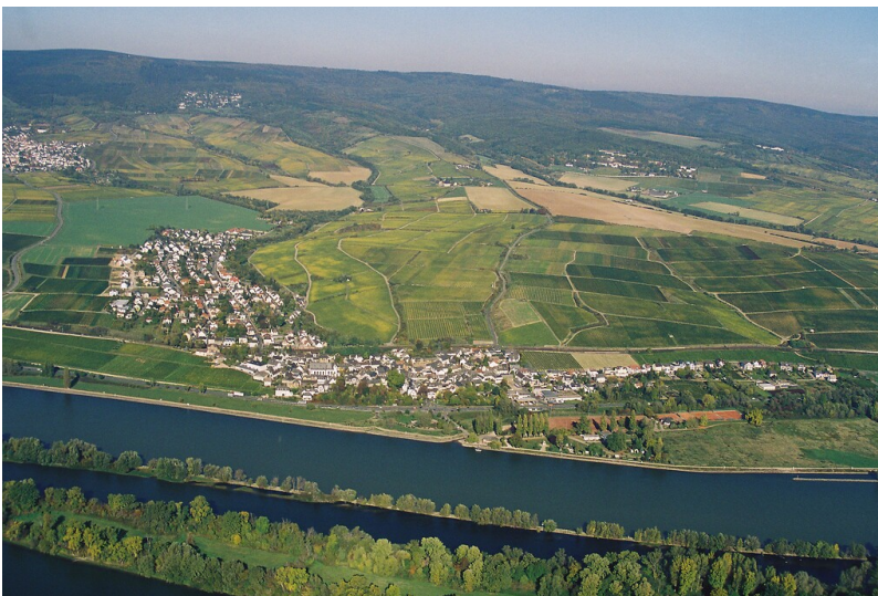
Luftaufnahme von Eltville-Hattenheim (2006)