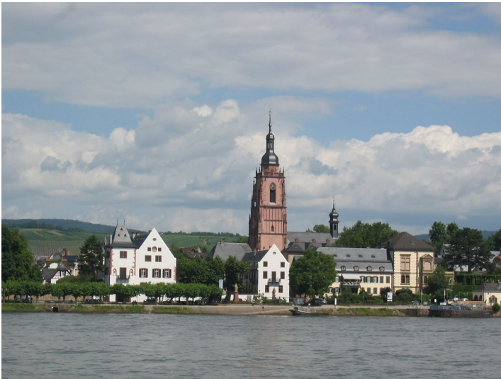
Blick vom Rhein auf Eltville