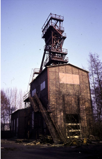
Fördergerüst der Zeche Zollverein 6,9 in Essen