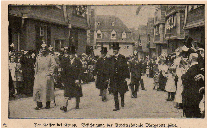
47 Der Kaiser bei Krupp. Besichtigung der Arbeiterkolonie Margarethenhöhe.

Historische Aufnahme (um 1910/13): "Der Kaiser bei Krupp." mit Kaiser Wilhelm II. und Gustav Krupp von Bohlen und Halbach.