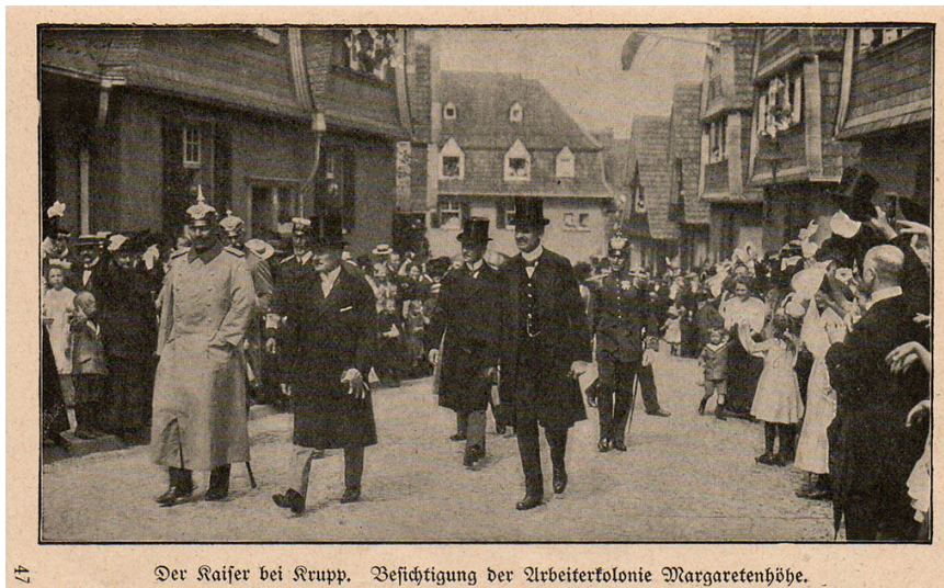
47 Der Kaiser bei Krupp. Besichtigung der Arbeiterkolonie Margarethenhöhe.

Historische Aufnahme (um 1910/13): "Der Kaiser bei Krupp." mit Kaiser Wilhelm II. und Gustav Krupp von Bohlen und Halbach.