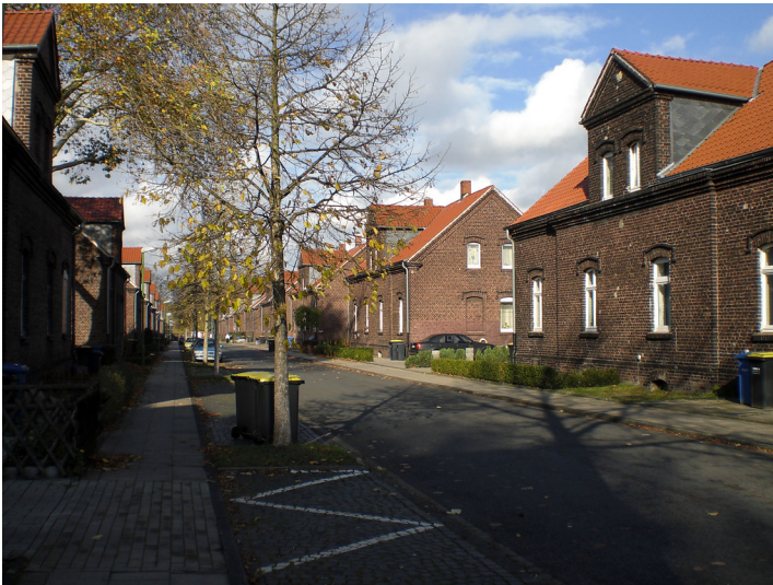
Siedlung Ottekampshof in Essen-Katernberg, Drokamp 4