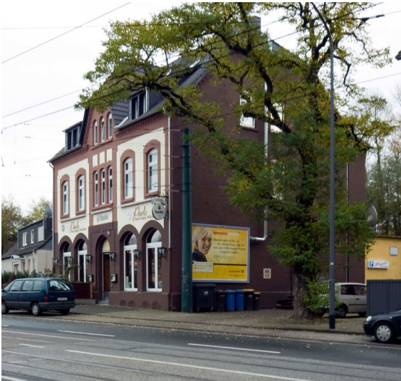
Konsumanstalt 6, Gelsenkirchener Straße 48 in Essen-Katernberg