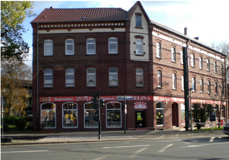
Konsumanstalt 4 der Siedlung Ottekampshof in Essen-Katernberg