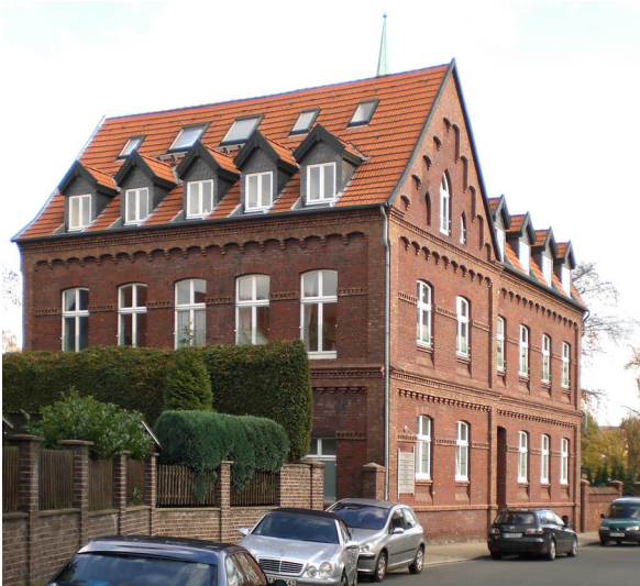
Siedlung Hegemannshof 1 der Zeche Zollverein in Essen-Katernberg, Teermerhöfe (2009).