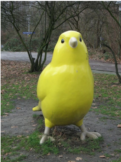
Der Katernberger Kanarienvogel. Symbol für den Bergbau in Katernberg am dortigen Meybuschhof (2011).