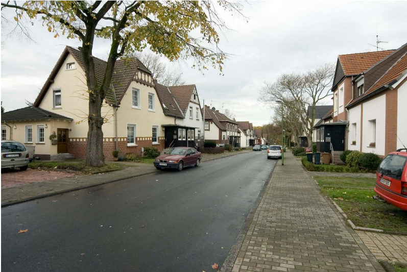
Siedlung Stiftsdamenwald in Essen-Katernberg