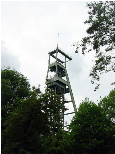
Fördergerüst der Zeche Heinrich (Schacht 3) in Essen-Überruhr-Holthausen (2009)