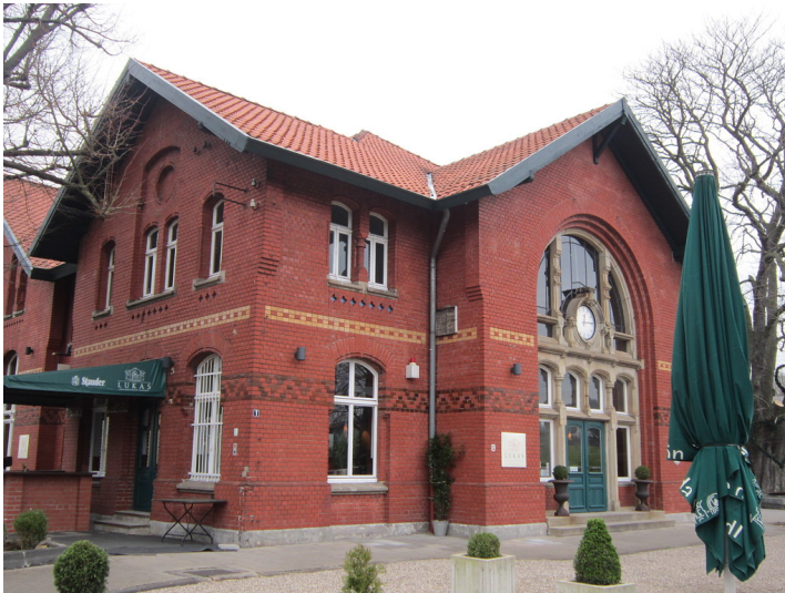
Essen-Kupferdreh, Ansicht des Empfangsgebäude Bahnhof Kupferdreh (2016)