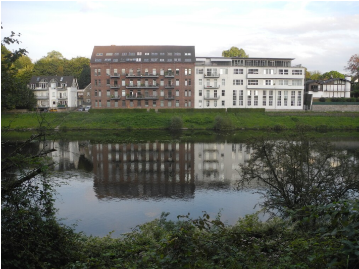
Tuchfabrik Feulgen in Essen-Werden mit Erweiterungsanbau (2024).