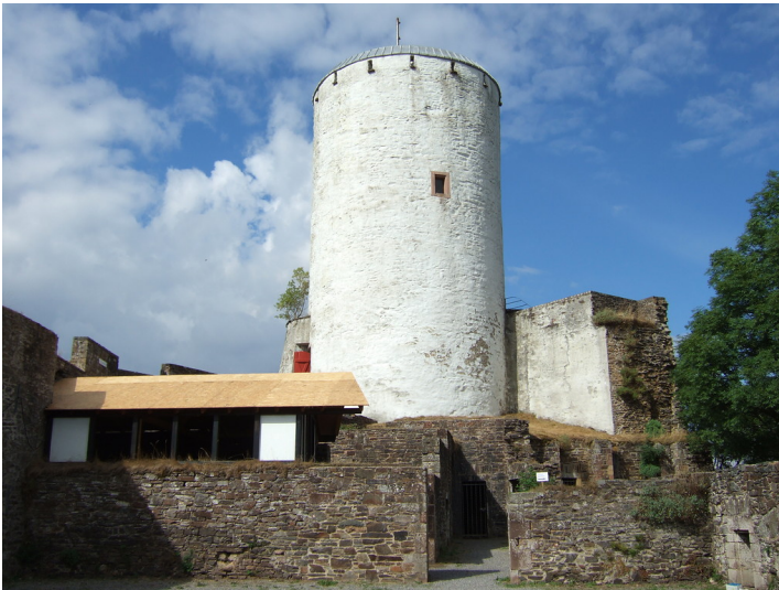
Bergfried der Burg Reifferscheid in Hellenthal (2013)