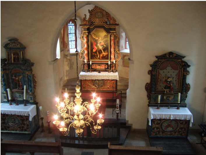
Innenraum der Wallfahrtskapelle St. Michael auf dem Michelsberg in Bad Münstereifel (2013)