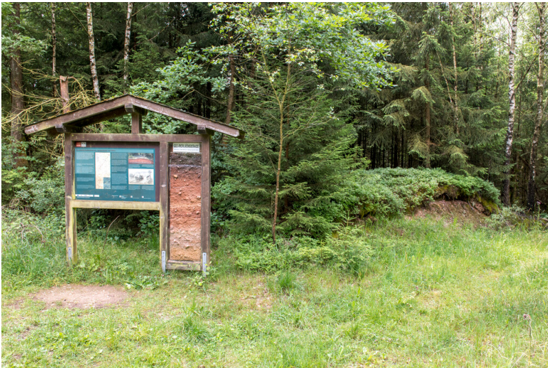
Damm der Agrippastraße bei Dahlem mit Infotafel und Lackprofil (2023).