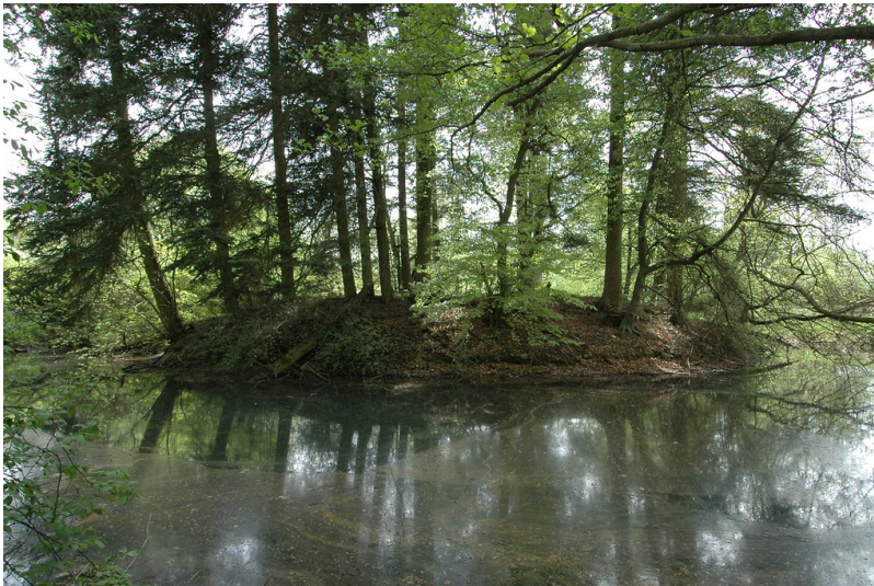
Motte Zehnbachhaus bei Dahlem-Schmidtheim (2006)