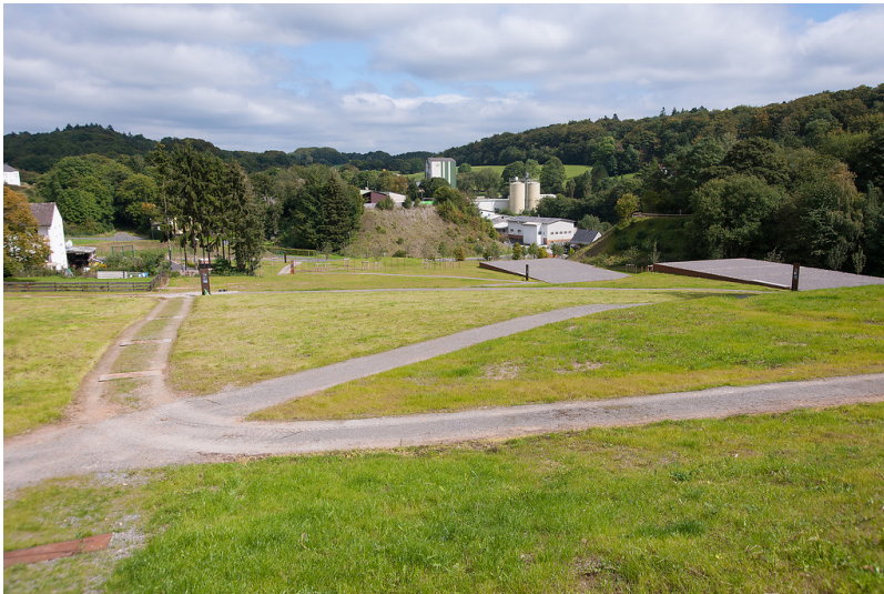
Blick über den ehemaligen Wirtschaftshof des römischen Landgutes (2014)