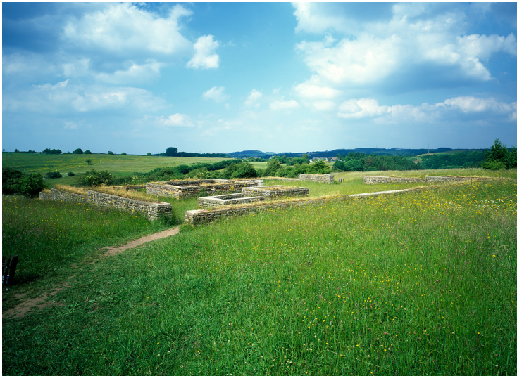
Matronenheiligtum „Görresburg“ in Nettersheim (2003)