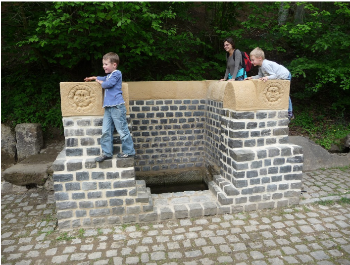
Das Bild zeigt das sanierte Absetzbecken am Grünen Pütz bei Nettersheim (2012).