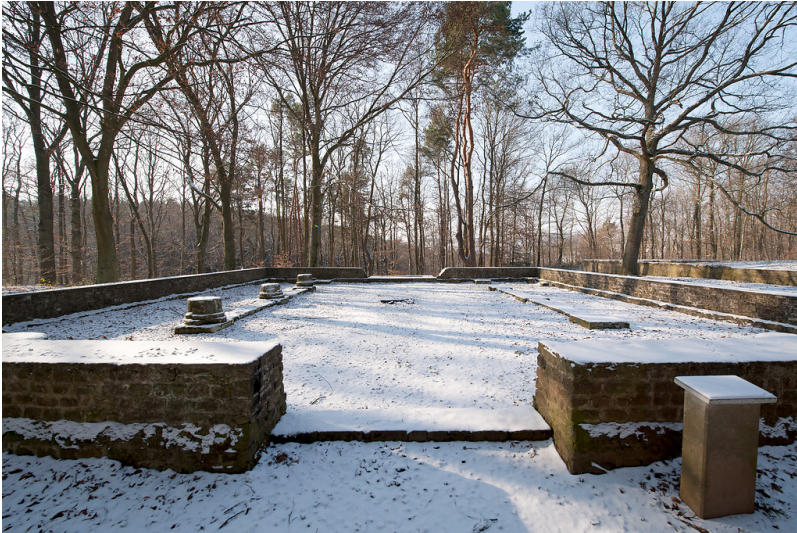
Römisches Matronenheiligtum "Heidentempel" bei Bad Münstereifel-Nöthen (2012)