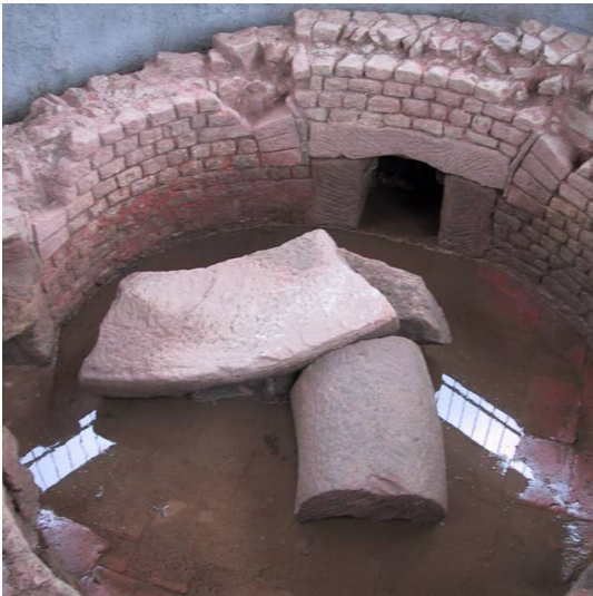
Sammelbecken des Römerkanals in Eiserfey während der Ausgrabung (1959).