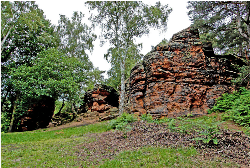
Katzensteine bei Mechernich-Katzvey (2008)