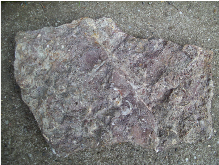
Marmorsteinbruch bei Kall-Urft (2010)