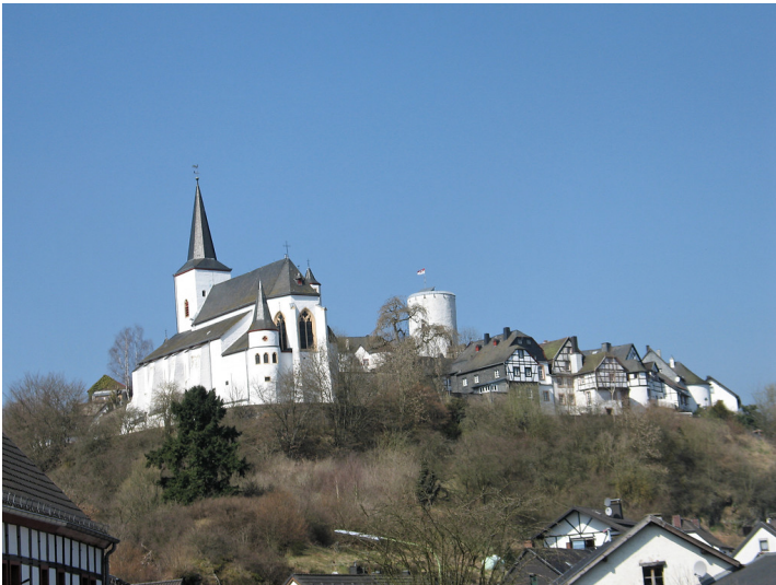
Burg und Burgsiedlung Reifferscheid bei Hellenthal (2009)