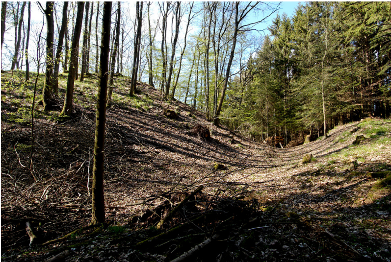
Burgwüstung „Altenberg“ bei Hellenthal-Wollenberg (2008)