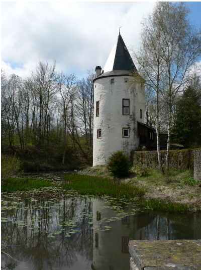
Wasserburg Dreiborn bei Schleiden (2008)