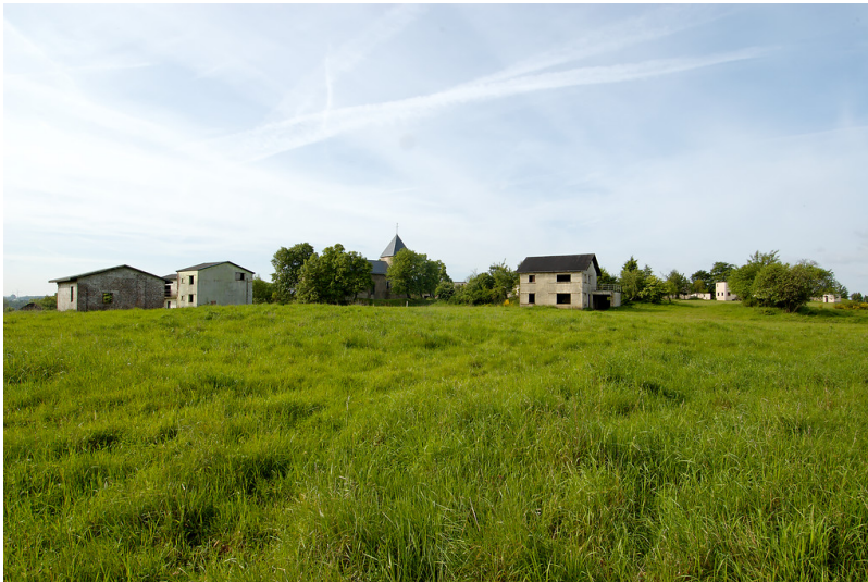
Dorfwüstung Wollseifen im Nationalpark Eifel in Schleiden (2009)