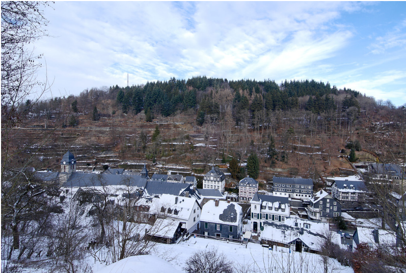
Der Rahmenberg bei Monschau (2009)